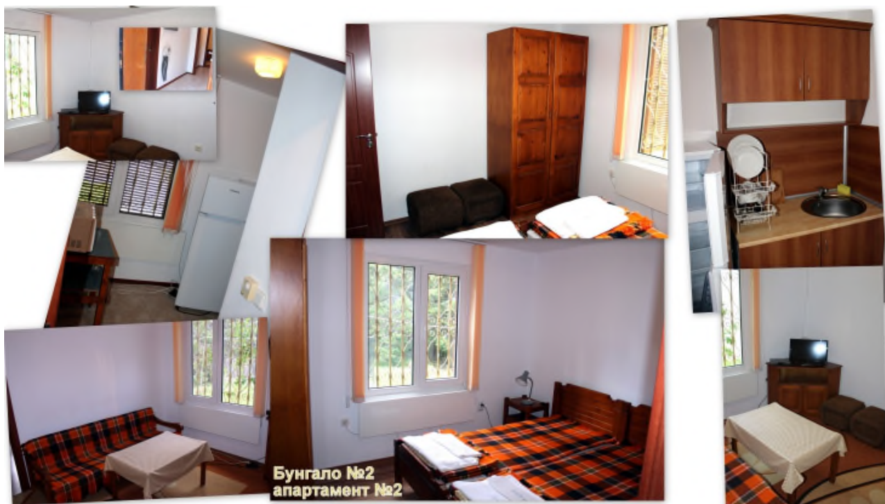
Бунгало №2 апартамент №2