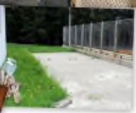
Барбекю "Райковски ливади"