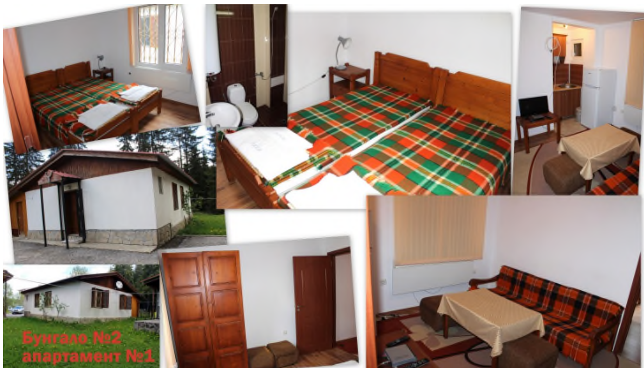
Бунгало №2 апартамент №1